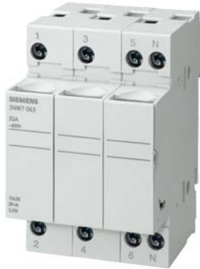
SENTRON, portafusibili per cartucce cilindriche, 10x38 mm, a 3 poli, In: 32 A, Un AC: 690 V