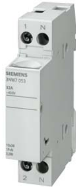
SENTRON, portafusibili per cartucce cilindriche, 10x38 mm, 1P+N, In: 32 A, Un AC: 690 V